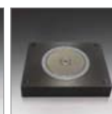
Magnetbasis Support magnétique