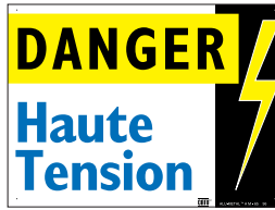
AM-65 - AM-65/1