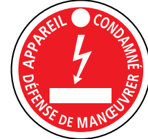
AP-467 - AP-467/1 AM-467