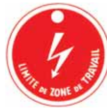
AP-621/3 - AM-621/3