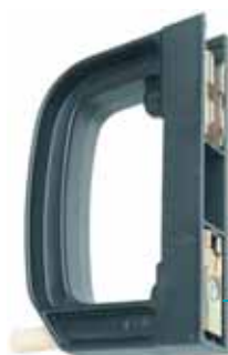
1 poignée de manœuvre MC-161.

1 ou 2 jeux de 3 couteaux, taille 2, entraxe 160 mm.